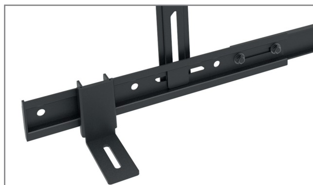
Breite variable einstellbar