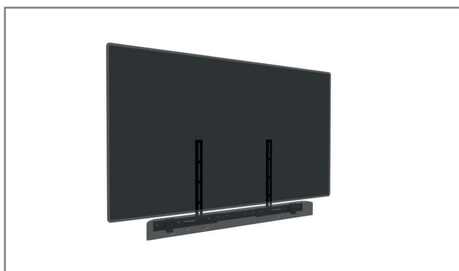
nutzbar mit jeder VESA-Universalaufnahme