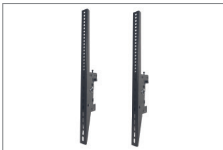
VESA max. 600 x 400 mm oder 400 x 600 mm

Die Komplettlösungen sind mit den Einzelkomponenten der comPROnents®-Serie uneingeschränkt kombinierbar und erweiterbar und bieten so weitere Einsatzmöglichkeiten.