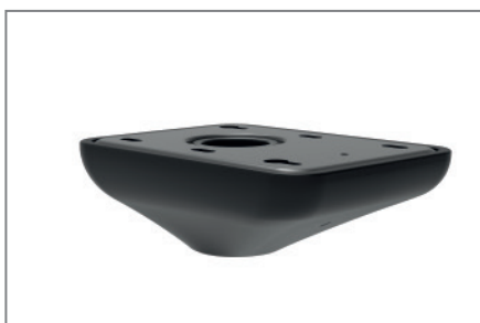
Sauberer Decken- und Bodenabschluss