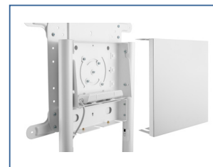
Steckdosenleiste mit Rückabdeckung